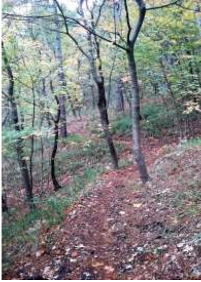
Foto: single trek chiesetta