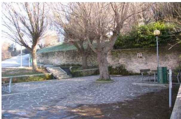
Foto : Sorgente Saletto

Punti di interesse: Piazza di Palazzo e sorgenti del Saletto, fontana sorgiva di Genga, Piantagione di Tartufi, panorama su chiesetta pineta Fossato di Vico, Rughe medievali e Municipio Comunale, chiesa di San Benedetto, fraz. Borgo di Fossato.