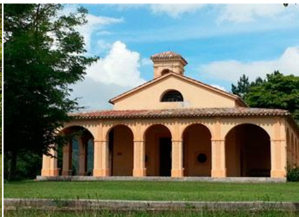
Località Vercata rifugio comunale, Santuario Madonna della Ghea