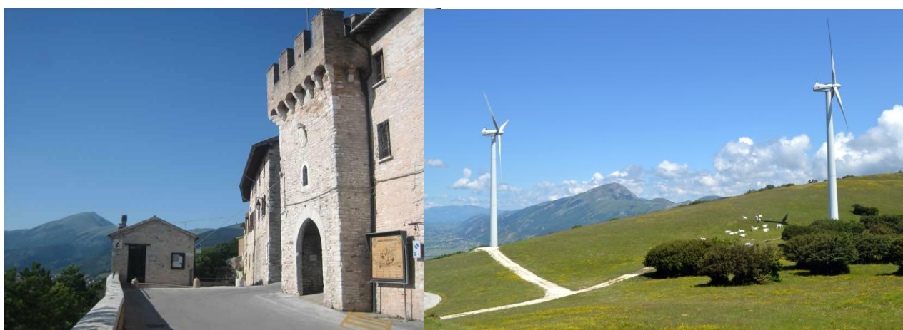
Foto della porta del Castello di Fossato di Vico e il Parco eolico di Cima Mutali, sullo sfondo il Monte Cucco

Per effettuare l'escursione è necessaria una buona condizione fisica e un adeguato allenamento al cammino .