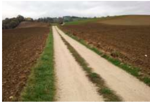
Foto: Campagna autunnale, piani di Fossato di