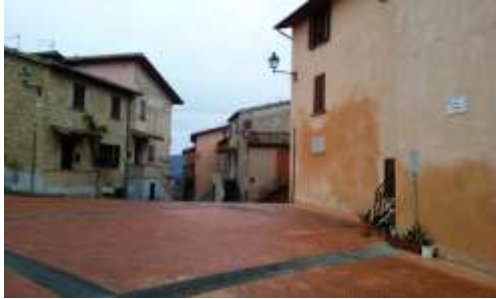
Foto: Piazzetta di Colbassano Vico